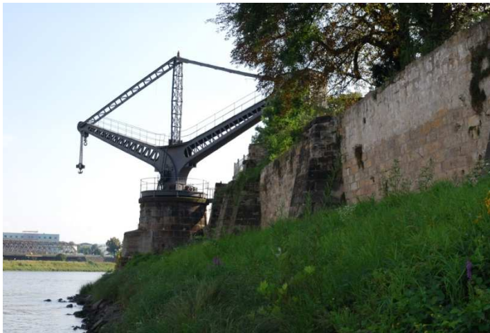
Übigauer Uferkran, Drehkran