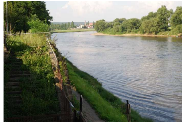
Teil des ehemaligen Weltkulturerbes „Dresdner Elbtal“