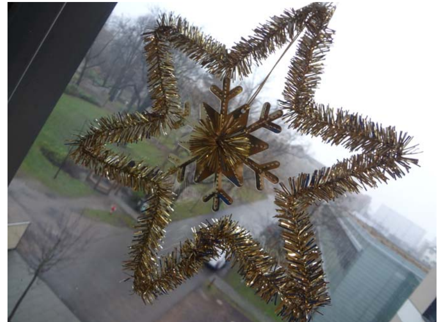
Foto: Weihnachtlicher Ausblick aus dem Schulzimmer der Klinikschule (von Vanessa)