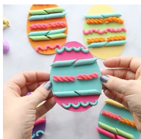
Ostereier mit Nudeln