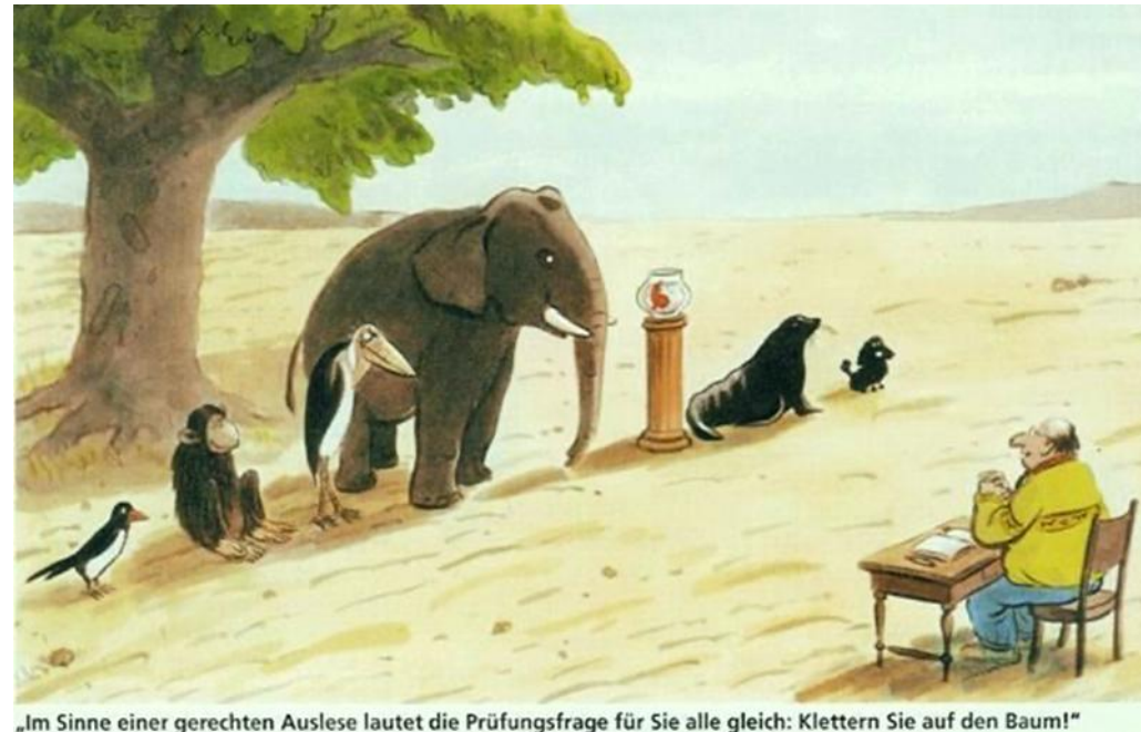
„Im Sinne einer gerechten Auslese lautet die Prüfungsfrage für Sie alle gleich: Klettern Sie auf den Baum!“