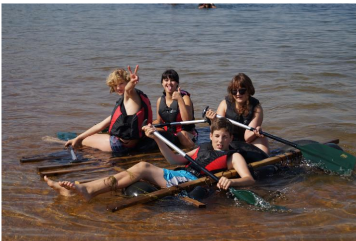
Floßbau Senftenberger See