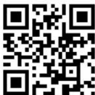
iPad - Führerschein

Der iPad-Führerschein wurde vom MPZ Mittelsachsen für Schülerinnen und Schüler der 3. und 4. Klasse entwickelt. Kann jedoch auch ohne weiteres zu Beginn der 5. Jahrgangsstufe eingesetzt werden.