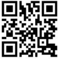
Mit - Musik Demo

Gemeinsames aktives Musizieren steht im Mittelpunkt des modernen Musikunterrichts in der Schule.