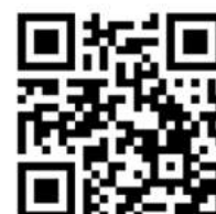
Demo - Video