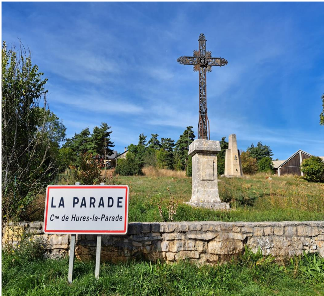
Ortseingang von La Parade (Stele im Hintergrund)