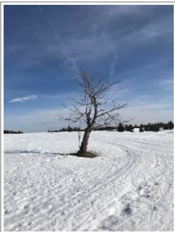
© Johannes Glowa, Cinovec, Aussig, CZ