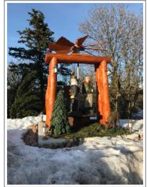
Pyramide Zinnwald Georgenfeld