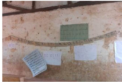
Wand in einem Klassenzimmer