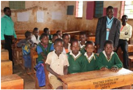
Vier Kinder teilen sich eine Schulbank