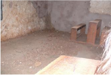
defekter Fußboden in eine Klassenzimmer