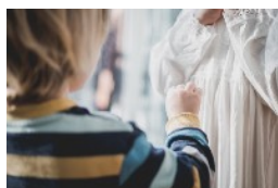
KURSE FÜR BABYS UND FAMILIEN MIT KLEINEN KINDERN