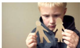
GRUPPEN FÜR ELTERN UND KINDER IN TRENNUNG