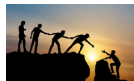
ONLINE SEMINARE FÜR ELTERN UND FACHKRÄFTE