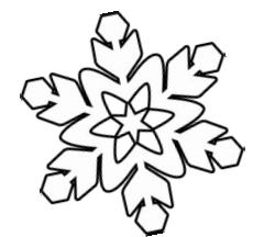
Winterbild von Anonymus, Klasse 4