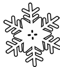
Zungenbrecher von Anonymus, Klasse 4

Unter einer Fichtenwurzel hör' ich einen Wichtel furzen. Sieben Schneeschipper schippen sieben Schippen Schnee.