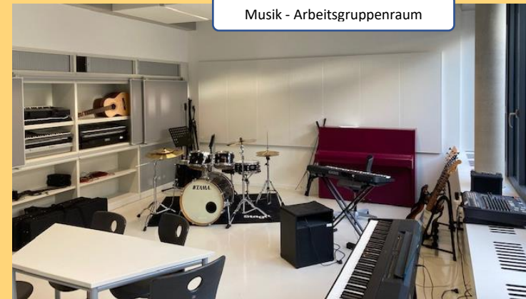
Musik - Arbeitsgruppenraum