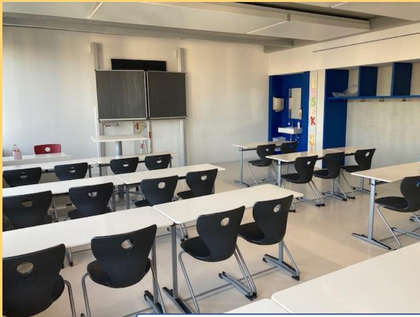
Klassenzimmer, gibt es mit Kreide- oder elektronischen Tafeln