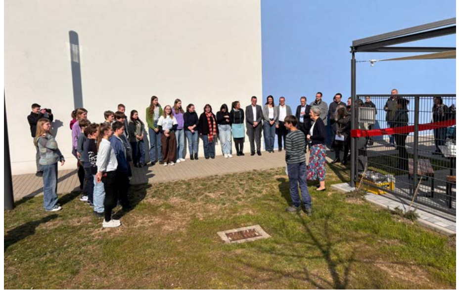
Zahlreiche Gäste sind der Einladung gefolgt