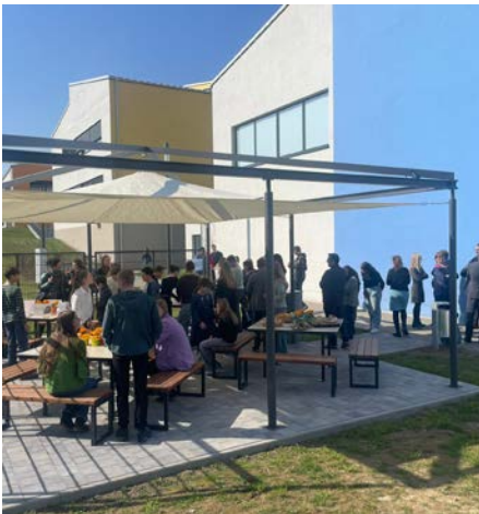
Im Anschluss konnte das Klassenzimmer und die aufgebauten Stationen in Augenschein genommen werden.