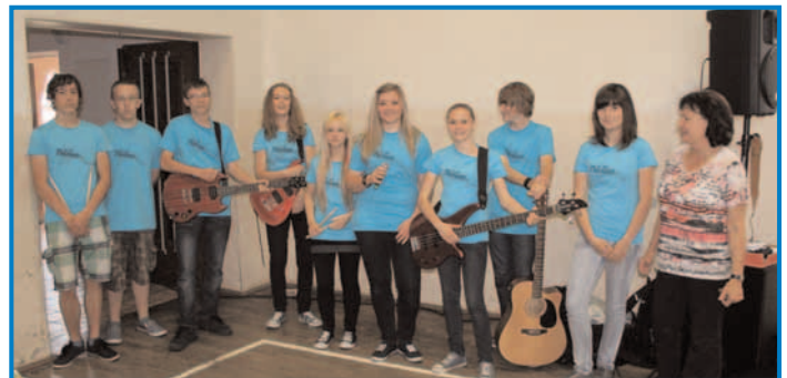
Die Schulband „meloteen“ in ihren neuen T-Shirts.

Die Schulband „meloteen“ sorgte für die kulturelle Umrahmung des Vormittages und er endete mit der Ausgabe der Zeugnisse.