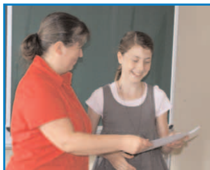
Die Klasse 6a erhält ihre Zeugnisse.